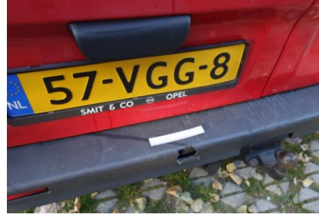
Bumper en stootlijsten die zwaar vervormd, gescheurd of gebroken zijn.