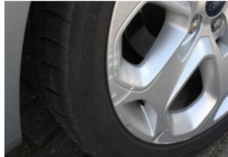
Krassen op velg.