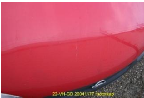
Lakbeschadiging door verwijderen van reclame.