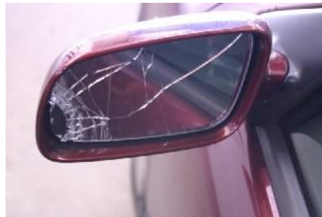
Gebroken of beschadigde spiegel.