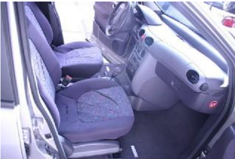
Scheuren en krasen in bekleding.

Verwijdering van eigen accessoires die na demontage zichtbare beschadigingen hebben achtergelaten is niet toegestaan.