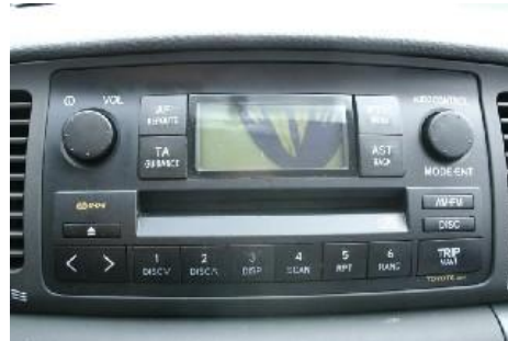
Beschadigde originele onderdelen.