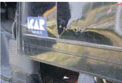
Beschadiging die van binnenuit is ontstaan door onvoldoende vastzetten van de lading.