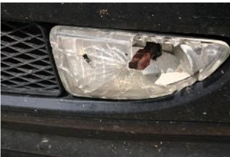
Gebroken glas van de mistlamp.