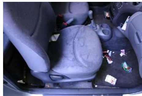
Vuil interieur wat reinigen noodzakelijk maakt.