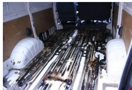
Door vloeistof aangetaste laadruimte.