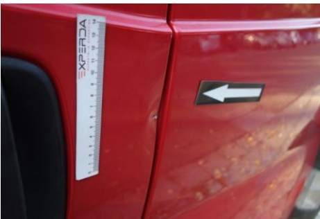
Vervorming waarbij de lak is gekraakt en of verwijderd.