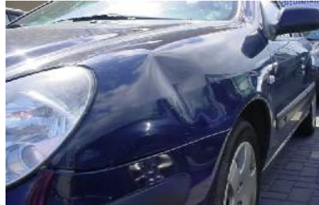
Beschadiging groter dan 24 mm (één euro muntstuk).