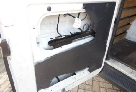
Binnenbekleding die zwaar beschadigd is of ontbreekt.

Vervorming of vernieling van de laadruimte is niet acceptabel.