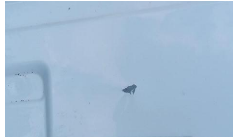
Kleine deuken die van binnenuit zijn ontstaan waarbij de lak beschadigd is.