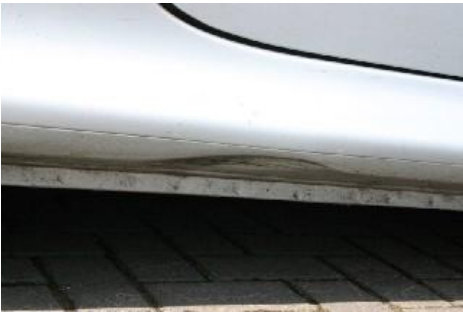
Beschadiging groter dan 24 mm.