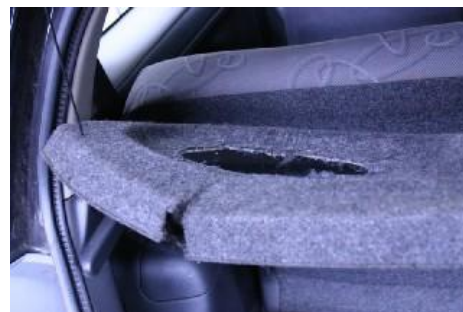
Montagegaten na demontage van accessoires.