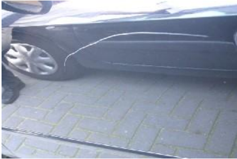
Kras die langer dan 10 cm en niet meer te polijsten is.

Schades die de waarde van de auto beïnvloeden en via de verzekering van de auto afgewikkeld moeten worden of waarvoor kosten in rekening worden gebracht, noemen we een niet acceptabele schade. Voorbeelden van niet acceptabele gebruiksschade: