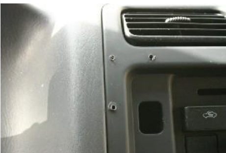
Montagegaten na demontage van accessoires.