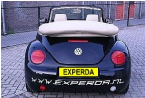
Niet verwijderde reclame.

Bij zichtbare verkleuring of als bij het verwijderen van de reclame de lak is beschadigd, zullen de kosten om dit te herstellen in rekening worden gebracht.