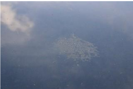
Aantasting van de lak door een van buitenkomend onheil.