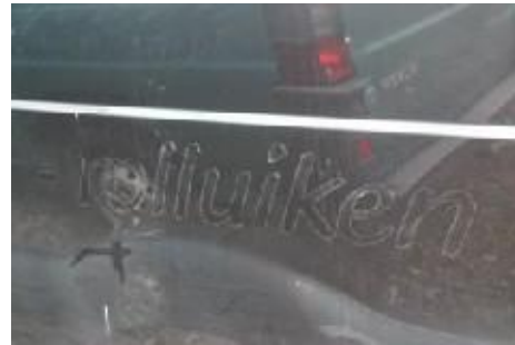
Verkleuring van de lak zichtbaar na verwijderen van reclame.