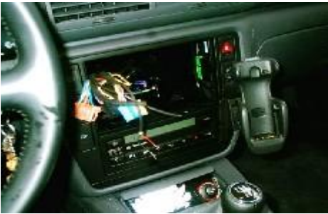
Gedemonteerde originele onderdelen.

Indien u zelf accessoires heeft gemonteerd, mogen deze worden verwijderd mits er geen beschadiging of gaten in de auto achterblijven.