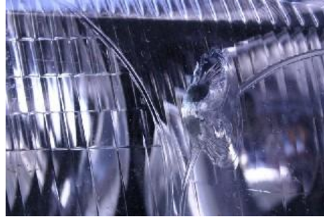
Gat in het glas.