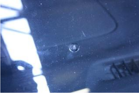
Ster en/of put.

De ruiten mogen in het directe gezichtsveld geen beschadiging en/of verkleuring hebben groter dan 20 mm. Buiten het gezichtsveld zijn putjes en sterretjes welke nog geen scheur vertonen van 35 mm of kleiner acceptabel.